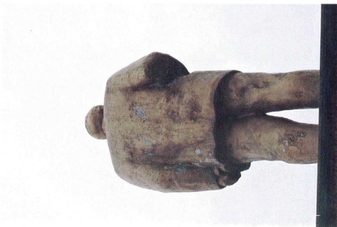
Фото 4 (повернуто). «Памятник В.И. Ленину», 1961 г., Кемеровская обл., г. Междуреченск. Фрагмент. Скульптура. Вид с юго-востока (на юго-восточный фасад)

Эксперт Е.П. Зыль Е.П. Зыль Дата: 13 июня 2017 года