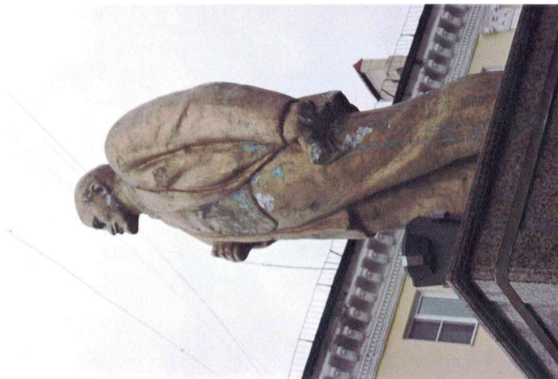
Фото 5 (повернуто). «Памятник В.И. Ленину», 1961 г., Кемеровская обл., г. Междуреченск. Фрагмент. Скульптура. Вид с юго-запада (на боковой фасад)

Акт № 300-30/БИКЭ «Памятник В.И. Ленину», 1961 г., Кемеровская область, Междуреченский городской округ, г. Междуреченск, пр-кт Коммунистический, между жилыми домами 1 и 2