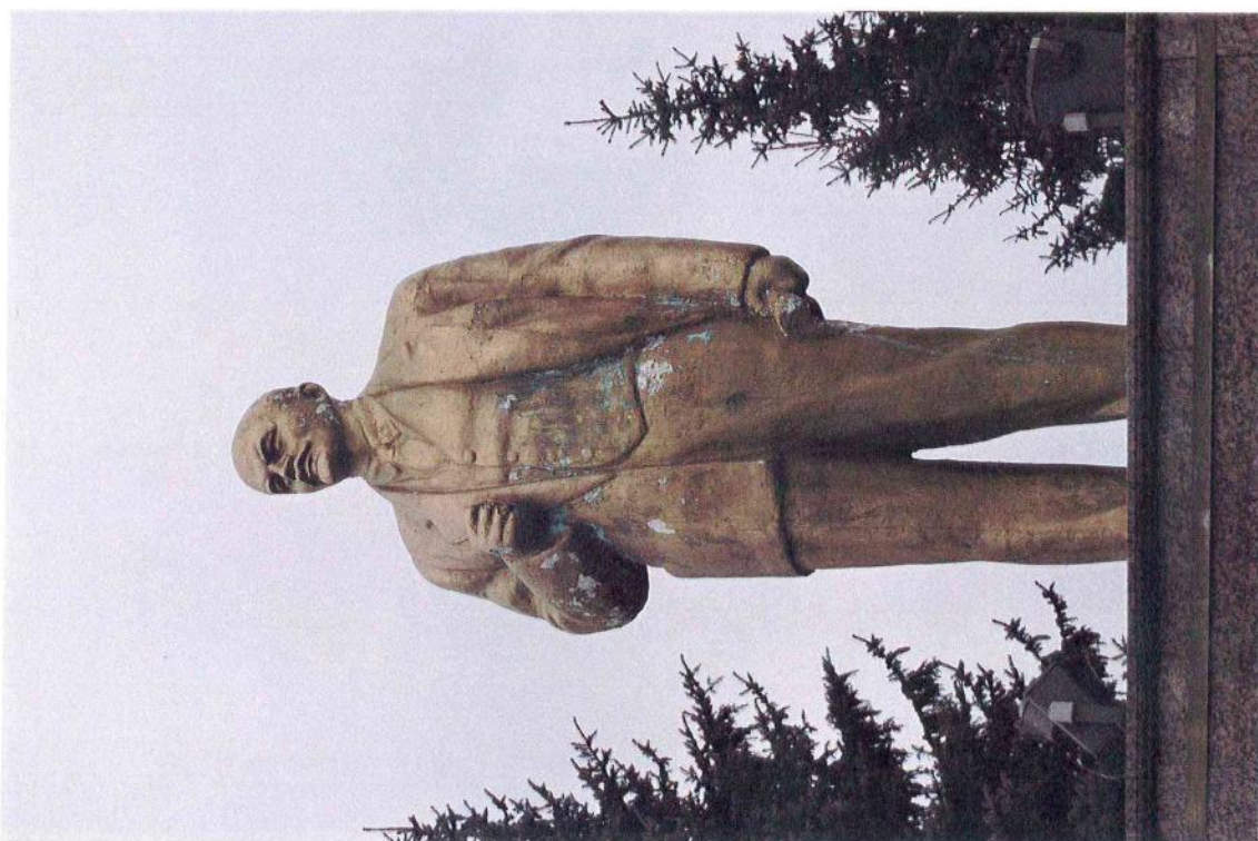
Фото 3 (повернуто). «Памятник В.И. Ленину», 1961 г., Кемеровская обл., г. Междуреченск. Фрагмент. Скульптура. Вид с северо-запада (на главный фасад)

Акт № 300-30/БИКЭ «Памятник В.И. Ленину», 1961 г., Кемеровская область, Междуреченский городской округ, г. Междуреченск, пр-кт Коммунистический, между жилыми домами 1 и 2