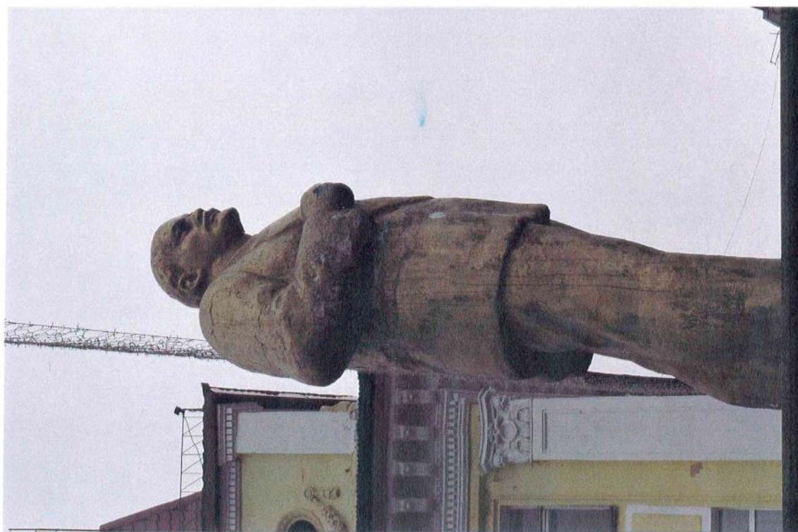
Фото 6 (повернуто). «Памятник В.И. Ленину», 1961 г., Кемеровская обл., г. Междуреченск. Фрагмент. Скульптура. Вид с северо-востока (на боковой фасад)

Эксперт Е.П. Зыль Е.П. Зыль Дата: 13 июня 2017 года