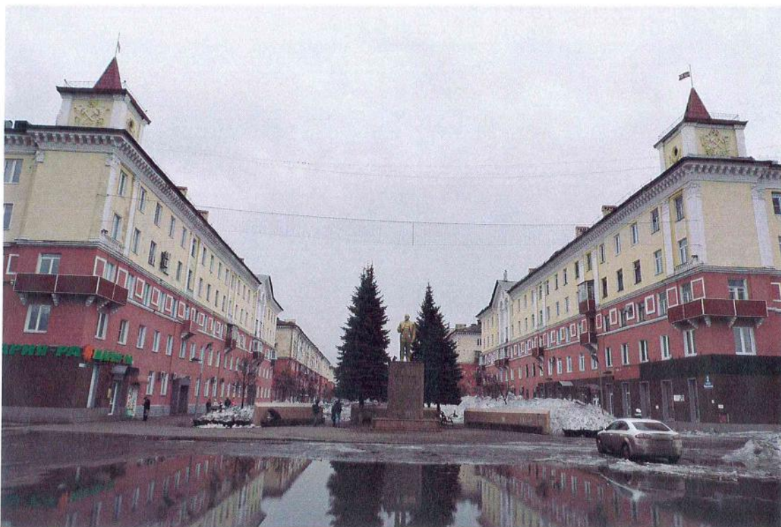
Фото 1. «Памятник В.И. Ленину», 1961 г., Кемеровская обл., г. Междуреченск. Общий вид с северо-запада (в перспективе Коммунистического проспекта)