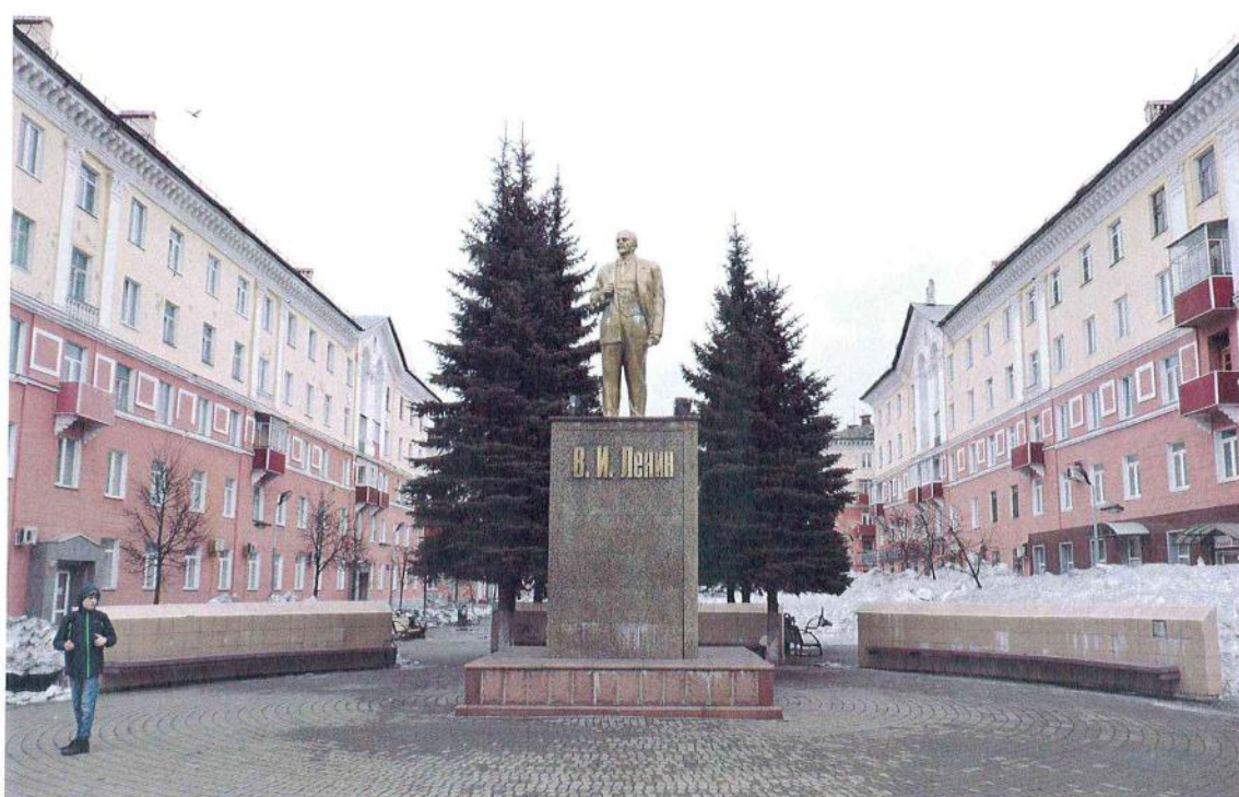
Фото 2. «Памятник В.И. Ленину», 1961 г., Кемеровская обл., г. Междуреченск. Вид с северо-запада (на главный фасад)

Эксперт Е.П. Зиль Е.П. Зиль Дата: 13 июня 2017 года