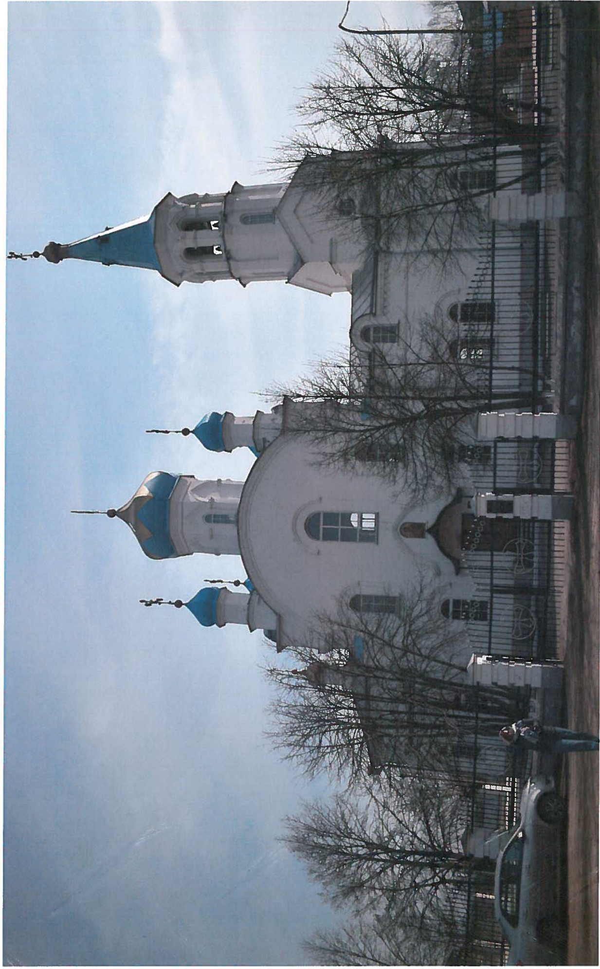
объект культурного наследия регионального значения «Свято-Троицкая церковь»