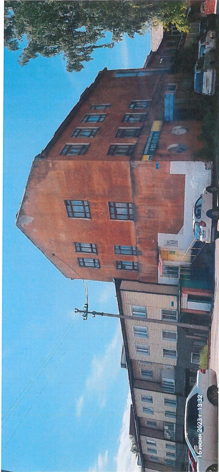
объект культурного наследия регионального значения «Дома коммуны»