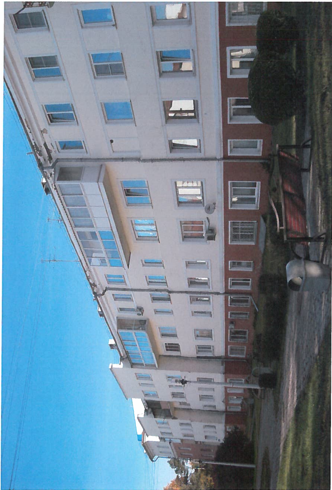
объект культурного наследия регионального значения «Дом жилой ТЭЦ»