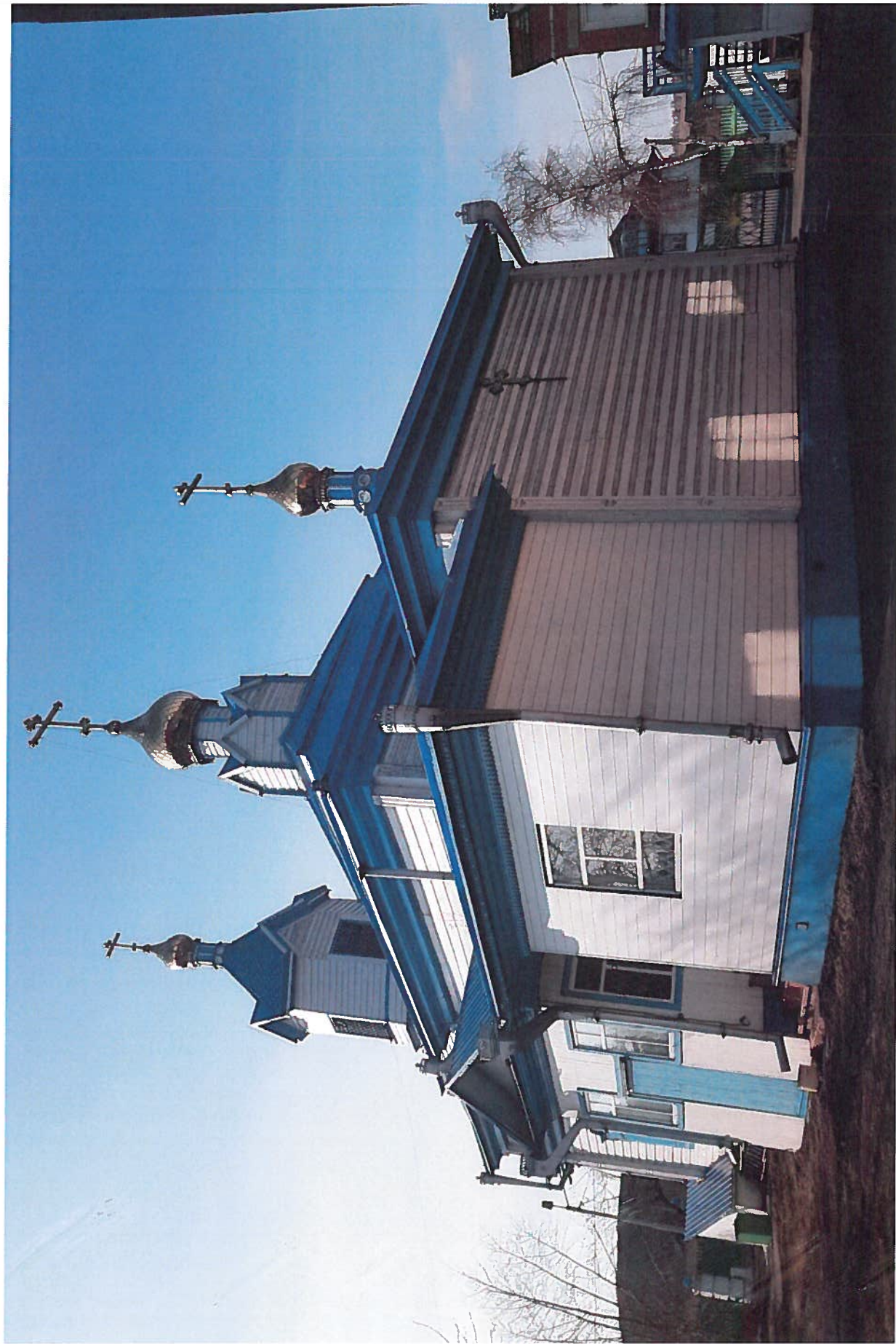
объект культурного наследия регионального значения «Петро-Павловская церковь»

адрес места нахождения: Кемеровская область - Кузбасс, г. Киселевск, ул. Чкалова, д. 27