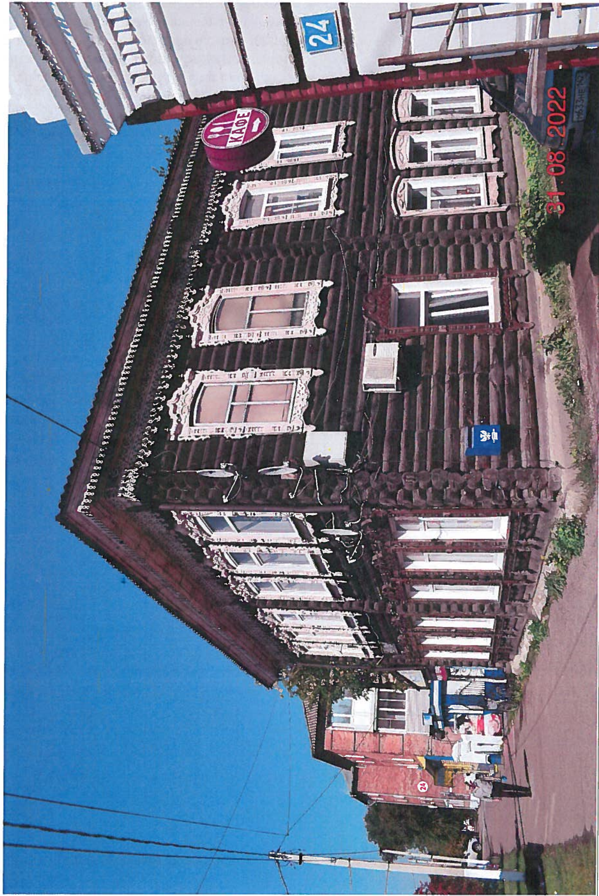
объект культурного наследия регионального значения «Двухэтажное деревянное здание начала XX века, украшенное обильной резьбой, ныне жилой дом» Дата съемки 31.08.2022 адрес места нахождения: Кемеровская область-Кузбасс, г. Мариинск, ул. Ленина, д. 26