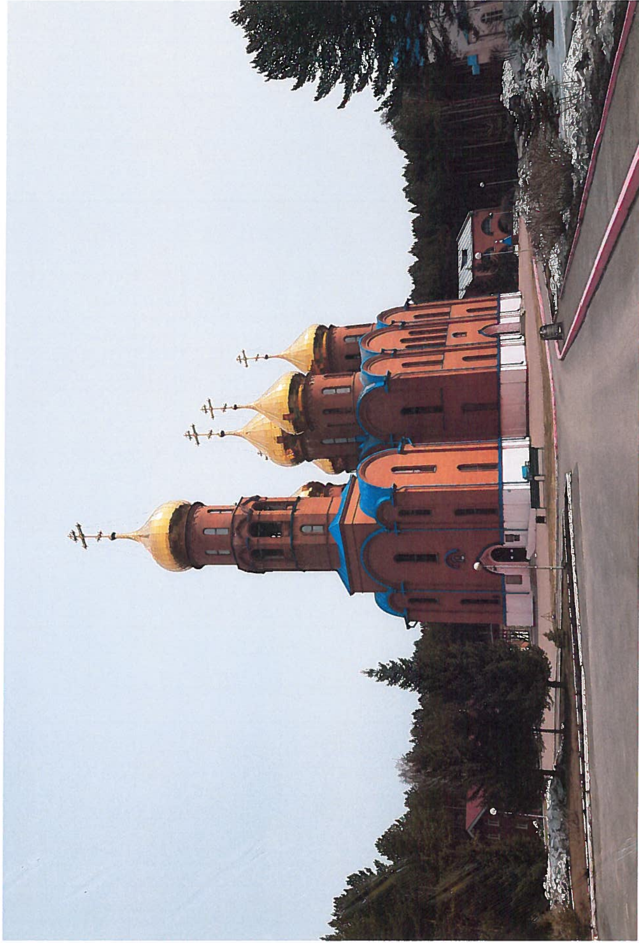
объект культурного наследия регионального значения «Собор Рождества Иоанна Предтечи»

адрес места нахождения: Кемеровская область - Кузбасс, г. Прокопьевск, пр-кт Строителей, д. 22